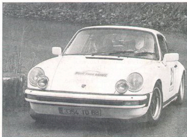
Voiture mythique, la Porsche 911 sera la reine de la fête

Les organisateurs veulent faire de la troisième Transvosg'Club, l'événement phare du Grand Est. "Nous avons choisi les plus belles routes vosgiennes. Nous tenons aussi à travers cet événement, à faire la promotion du département." Désormais pour que la fête soit complète il ne reste plus que la météo soit clémente durant tout le week-