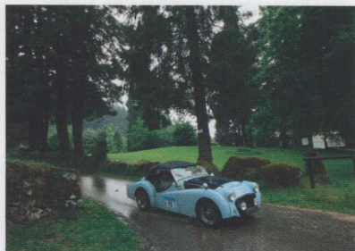
La pluie ne semble pas perturber l'équipage de cette Triumph TR3.