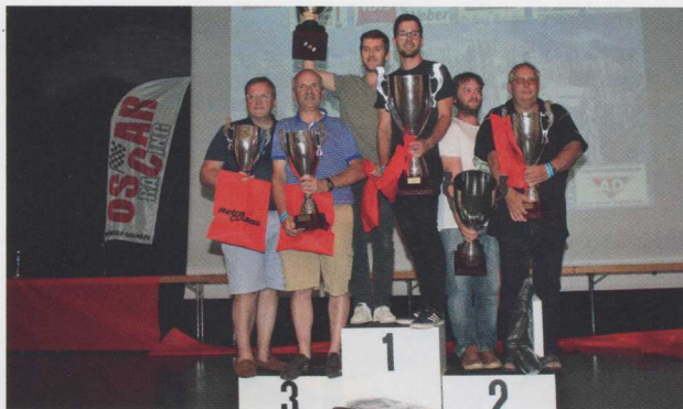
Le podium final.