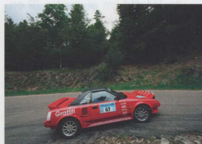
Le coupé Toyota MR 2 « compressé » par l'effet d'optique.