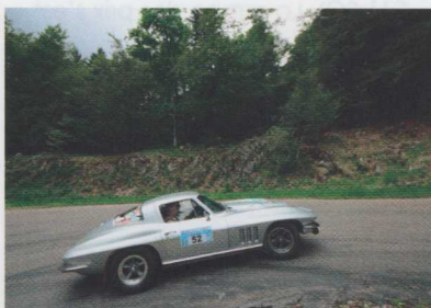
La puissance de la Corvette est idéalement adaptée aux routes de la région.